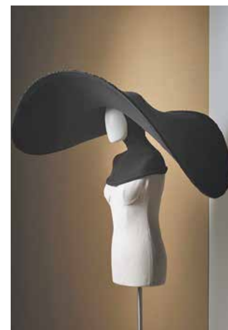
20 GODINA REVOLUCIJE Prva je izložba "Dvadeset godina suvremene modne revolucije", a kustos je Olivier Saillard, bivši direktor Palais Galliera u Parizu

«Zasad je muzej na 1400 četvornih metara, no širit će se na 7000 kvadrata»