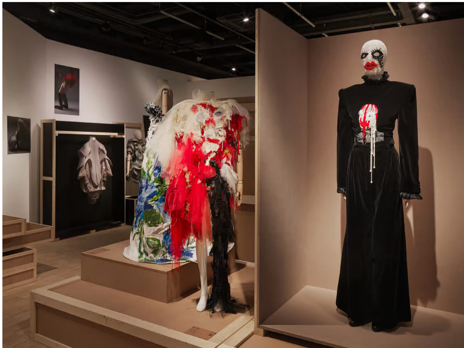
Its Arcademy, courtesy of Massimo Gardone

“Questo patrimonio in costante crescita, cui si aggiungono continuamente nuovi e preziosi portfolio, abiti, accessori e gioielli, può competere con le collezioni dei grandi musei a livello mondiale e divenire il primo museo della moda interamente dedicato alle forme e alle espressioni più contemporanee della nostra epoca.” dice Olivier Saillard.