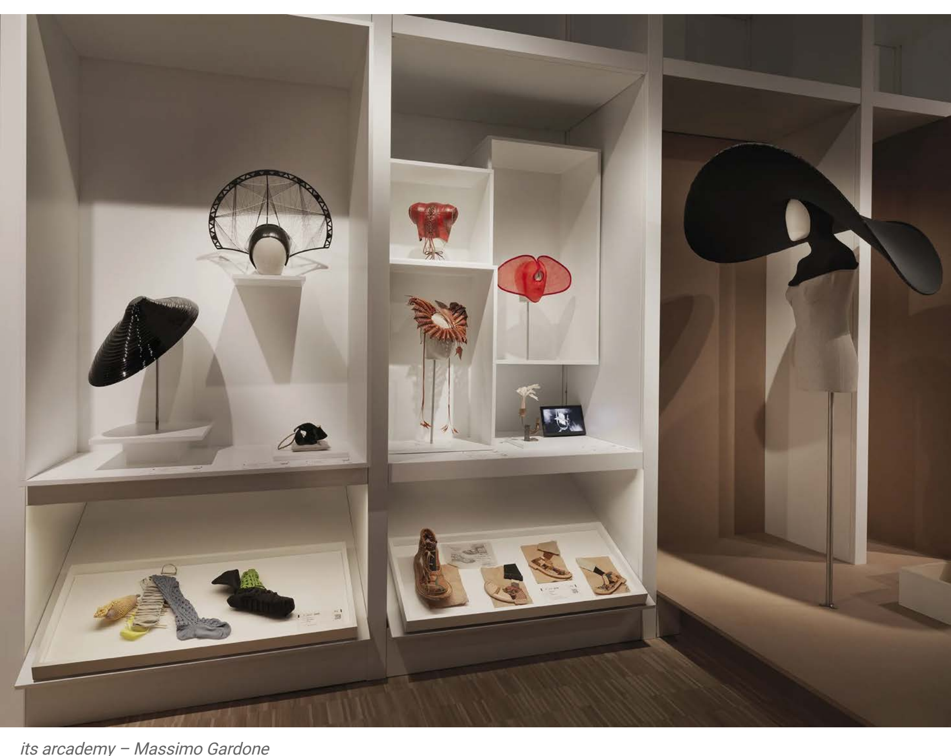
its arcademy – Massimo Gardone

A due passi dall'immensa piazza Unità d'Italia , salotto della città, e dal respiro del mare del lungo Golfo. Si chiama ITS Arcademy – Museum of Art in Fashion , ed espone alcuni pezzi dell'impressionante collezione di ITS Arcademy: 14.758 portfolio, 1089 abiti, 163 accessori, 118 gioielli, 700 opere fotografiche .