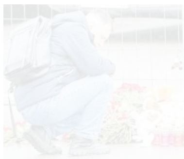
L'omaggio alle vittime

L'ASSALTO ISIS, PUTIN ACCUSA Mosca, arrestati 4 attentatori «Erano in fuga verso l'Ucraina»