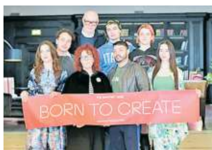
Un momento dell'evento