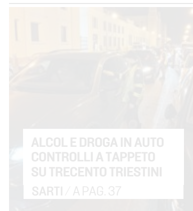
ALCOL E DROGA IN AUTO CONTROLLI A TAPPETO SU TRECENTO TRIESTINI SARTI / APAG. 37